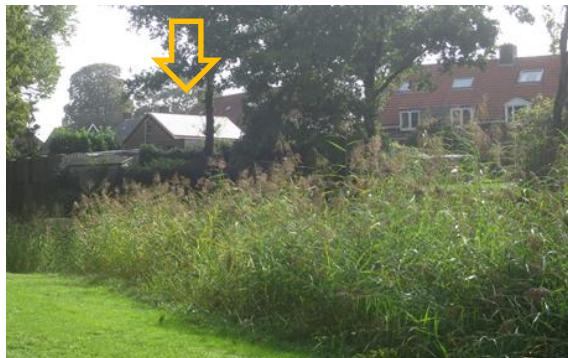
Ad.2 (links) Zonnepanelen op dakvlak van pand langs Bergstraat zichtbaar vanaf Meipoortwal en (rechts) zonnepanelen op bijbehorend bouwwerk in achterterefgebied van bebouwing langs de Nahuysingel