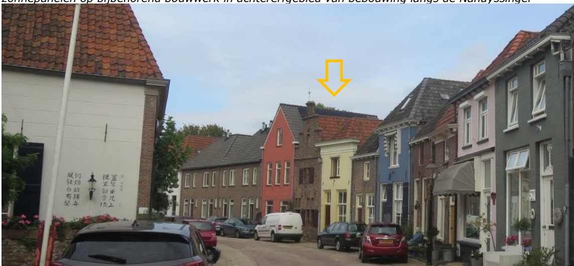
Ad. 3 Op het zijdakvlak van pand langs de Bergstraat, beperkt zichtbaar vanaf openbaar gebied.