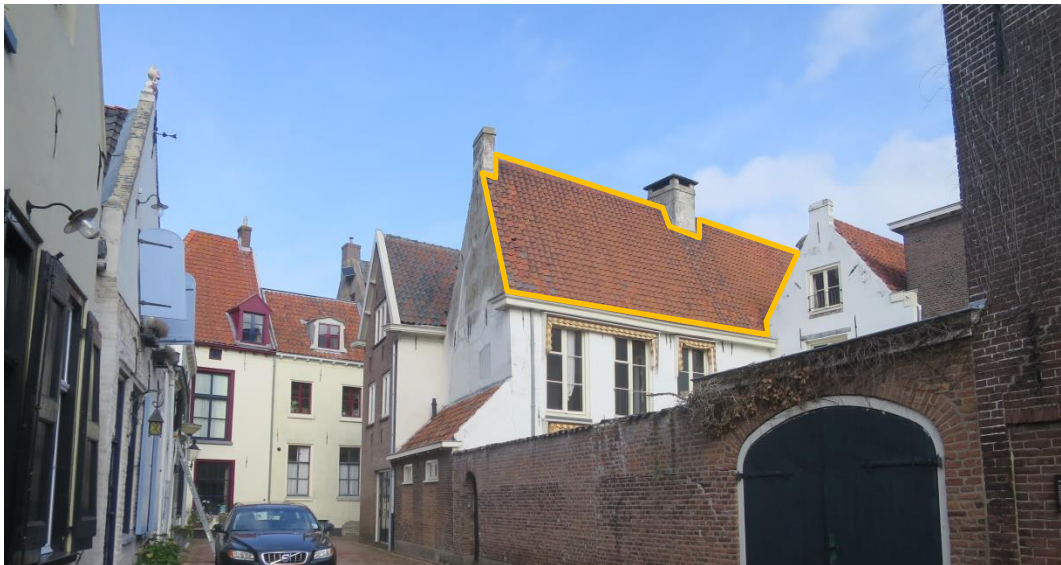
Goed in het zicht gelegen zijdakvlak. Niet geschikt voor zonnepanelen.

Bij het plaatsen van zonnepanelen blijft het een aanbeveling om eerst het gas- en energieverbruik zoveel mogelijk te verlagen met alle mogelijke maatregelen die (indien van toepassing) ook geschikt zijn voor het monument en vervolgens op zoek te gaan naar een locatie die niet te zien is vanaf openbaar toegankelijk gebied.