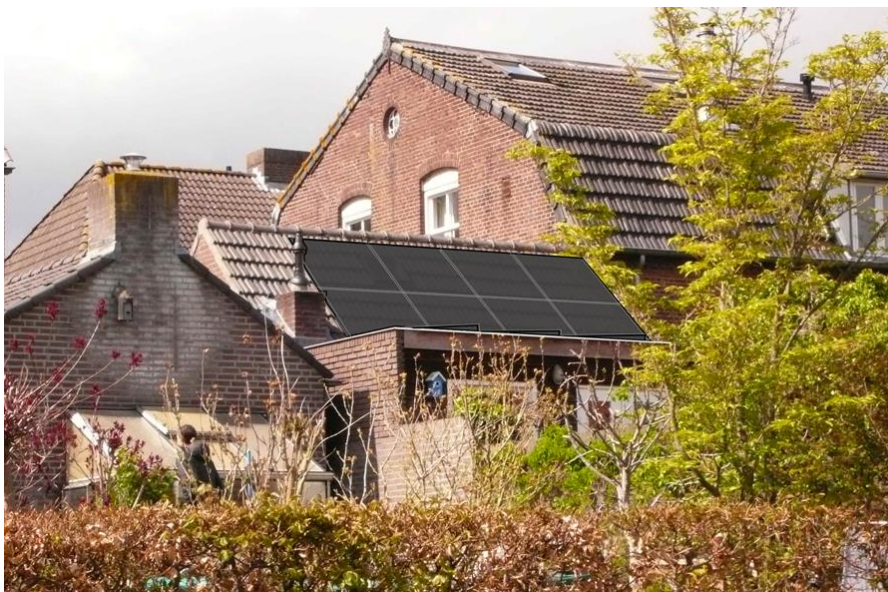
Referentievoorbeld van een fotomontage voor het plaatsen van zonnepanelen op het dakvlak van een pand gelegen in het beschermde stadsgezicht van Ravenstein.

Bij het plaatsen van zonnepanelen op een monument wordt gevraagd om aan te geven hoe de panelen worden gemonteerd. Bij uitzondering blijft de mogelijkheid bestaan dat extra gegevens nodig zijn om de aanvraag te kunnen beoordelen in relatie tot de monumentale waarden en de waarde van het beschermde stadsgezicht.