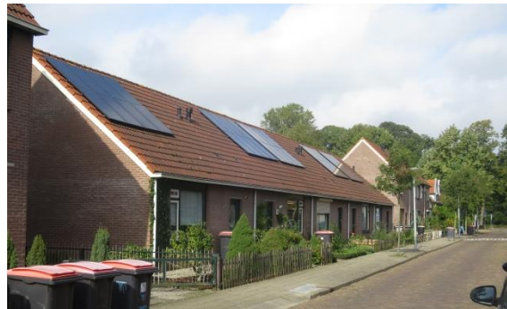
Ad. 1 Niet historisch bebouwingsbeeld met zonnepanelen op het voordakvlak langs de Julianastraat